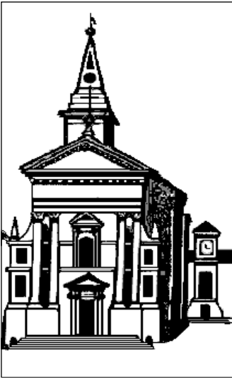
Santa Maria di Baricella