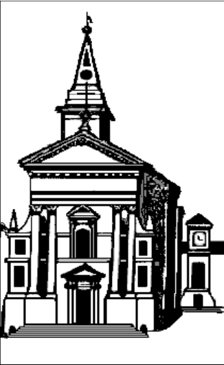
Santa Maria di Baricella